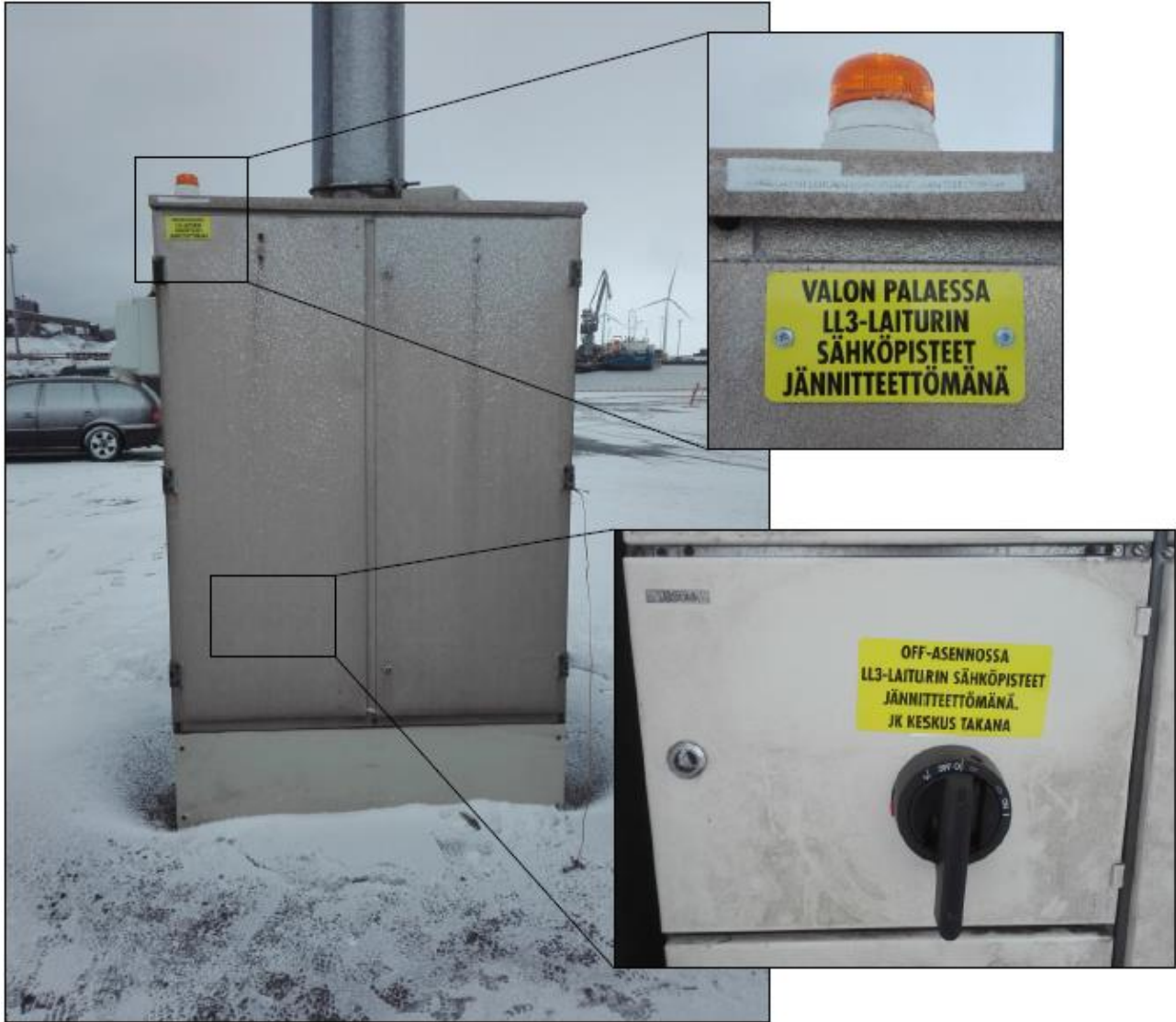
Kuva: Hinaajalaiturin sähkökeskus

Turva-alue on yhdestä autosta bunkrattaessa 25 m ja kahdesta autosta bunkrattaessa 30 m maadoitetun pollarin ympärillä.